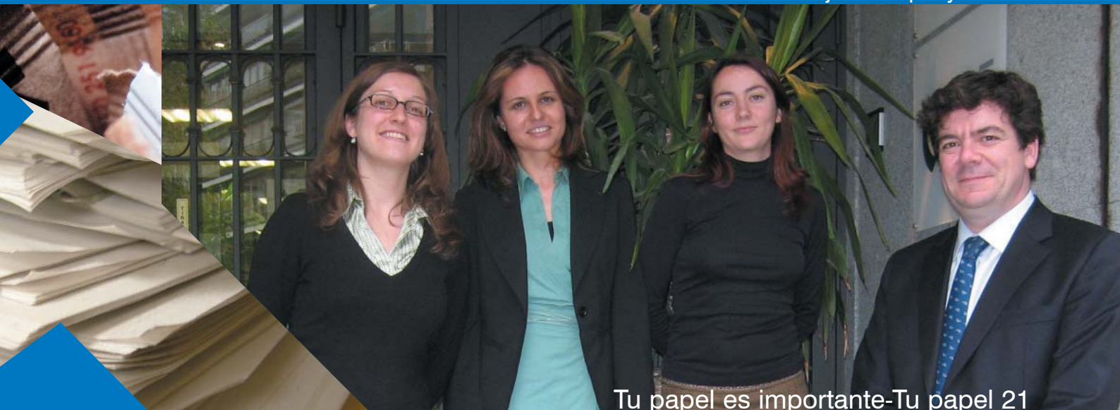
Tu papel es importante-Tu papel 21

Boletín Informativo del Reciclaje de Papel y Cartón