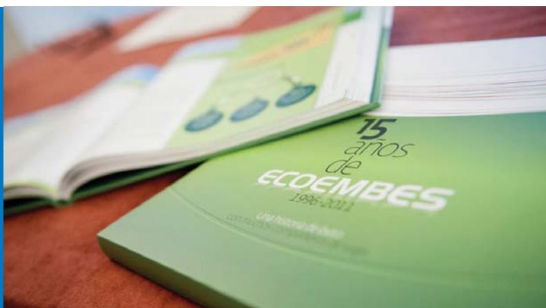
El libro 15 años de Ecoembes. Una historia de éxito con muchos compañeros de viaje , disponible en: http://www.ecoembes.com

Ecoembes cumple 15 años de éxito en la gestión de la recuperación y el reciclaje de los envases de plástico, metal y briks (contenedor amarillo) y papel y cartón (contenedor azul). Una historia de éxito con muchos compañeros de viaje es el título del libro, editado con ocasión de este aniversario, que compendia el nacimiento, evolución y desarrollo de la organización.